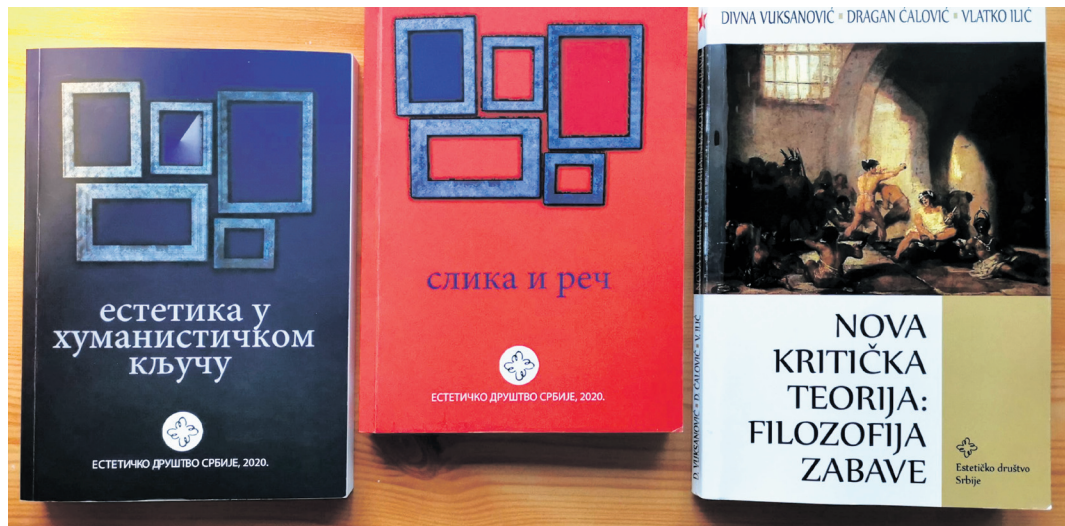
Зборници и прве књиге из едиције „Естетичка истраживања” као издања ЕДС